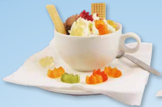
Eisbecher für Kinder ohne Sahne 3,50 € mit Sahne 4,00 €