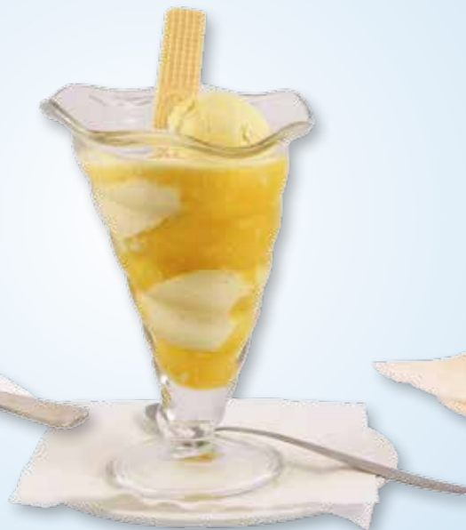
Tropica Orangensaft mit Vanilleeis 3,50 €