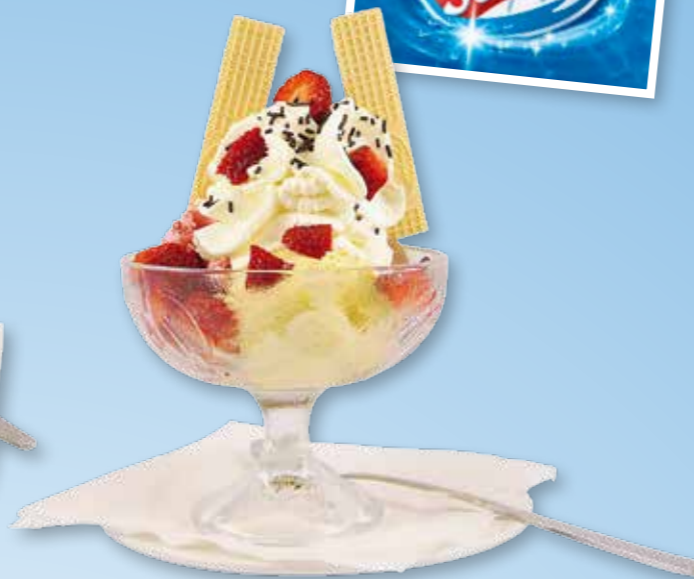
Eselbecher à la Esel- & Landspielhof je nach Jahreszeit mit Erdbeeren oder Früchten ohne Sahne 5,00 € mit Sahne 5,50 €