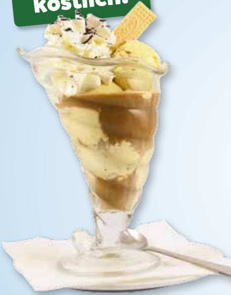
Eiskaffee 3,50 €